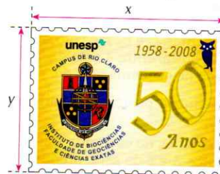
Selo visto a olho nu

P. 358 (Vunesp) Para observar detalhes de um selo, um filatelista utiliza uma lente esférica convergente funcionando como lupa. Com ela, consegue obter uma imagem nítida e direita do selo, com as dimensões relativas mostradas na figura.