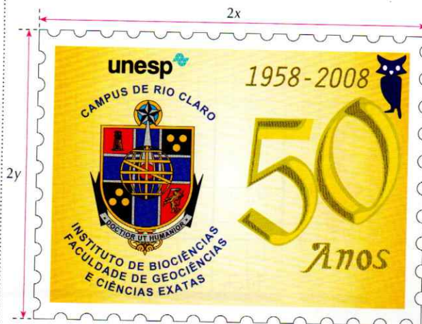
Imagem do selo vista através da lente